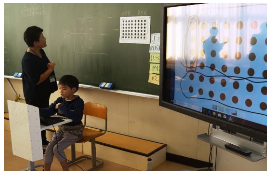
【2年生】これまで習った九九を使って解く工夫