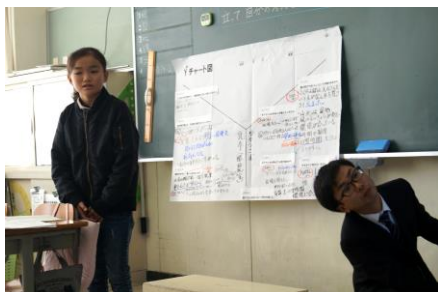
【5年生】Yチャートを基にして自分達で話し合い