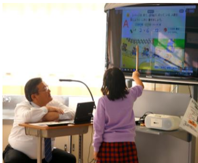
【さくらんぼ2組】かけ算の仕方を説明