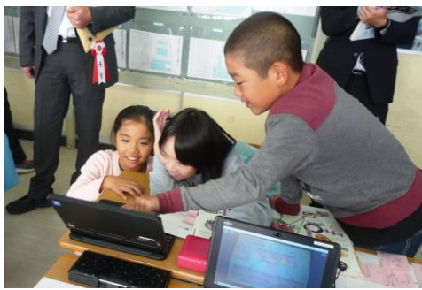
【3年生】国語の学習 互いの考えを比べ合う