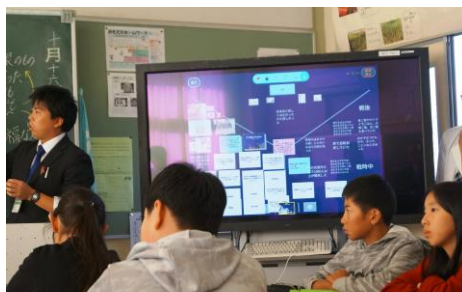
【6年生】作ったYチャートを見合いながら社会科の学習