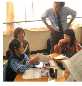
【4年生】プログラミング学習で工夫