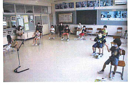
【1年1組 2時間目 国語 3時間目 音楽】