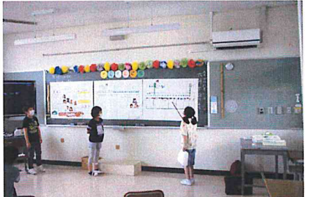
【さくらんぼ学級1・2組 1年生を迎える会】