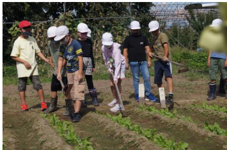
【9月23日】草取りと土かけ