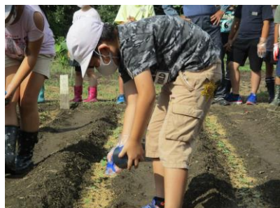
【9月15日】水やりの様子